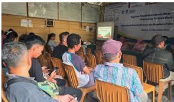
Gambar 2. Sosialisasi Pengelolaan Dana BUMDes