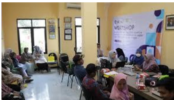
Gambar 3. Sosialisasi Sistem Keuangan

Dari aspek kelembagaan, kegiatan pengabdian ini berhasil memperkuat sistem kontrol internal di BUMDes melalui pembentukan mekanisme audit sederhana berbasis dokumen transaksi. Setiap BUMDes mitra kini memiliki struktur administrasi keuangan yang lebih tertib dengan pemisahan antara dana operasional dan dana sosial. Temuan ini sejalan dengan penelitian yang menekankan pentingnya audit internal sebagai instrumen pencegahan penyimpangan dana desa. Namun, kegiatan ini melangkah lebih jauh karena tidak hanya membangun mekanisme administratif, tetapi juga membentuk kesadaran etis di kalangan pengurus mengenai pentingnya integritas dalam pengelolaan keuangan publik. Proses pelatihan yang memadukan teori, praktik, dan nilai moral ini membuktikan bahwa pendekatan edukatif holistik lebih efektif dalam membangun tata kelola keuangan yang berkelanjutan dibandingkan pendekatan teknokratis semata. Di sisi lain, hasil pengabdian ini juga memperlihatkan keterbatasan yang serupa dengan beberapa penelitian sebelumnya konsistensi pelaporan dan akuntabilitas masih bergantung pada komitmen individu pengurus dan dukungan dari pemerintah desa ( Jurnal Pemberdayaan dan Inovasi Desa ). Oleh karena itu, keberlanjutan dampak dari kegiatan ini memerlukan kebijakan pendampingan berkala serta pembinaan institusional yang lebih kuat dari pemerintah daerah. Jika dibandingkan dengan studi-