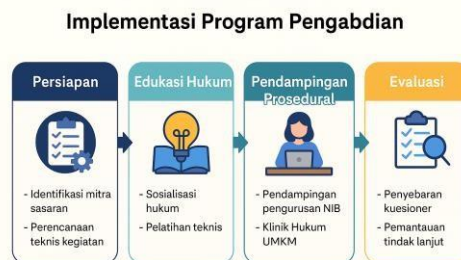
Gambar 1. Implementasi Pengabdian Kepada Masyarakat

Pelaksanaan kegiatan pengabdian masyarakat ini dirancang secara sistematis dan partisipatif, agar tujuan yang telah ditetapkan dapat tercapai secara efektif serta berkelanjutan. 10 Pendekatan metode yang digunakan dalam pengabdian ini adalah community legal empowerment , yakni pemberdayaan hukum berbasis komunitas, yang dikombinasikan dengan metode edukatif, fasilitatif, dan advokatif. Implementasi kegiatan pengabdian dilakukan melalui empat tahapan utama : persiapan, pelaksanaan edukasi hukum, pendampingan prosedural, dan evaluasi. 11 Setiap tahapan dirancang untuk menjawab permasalahan nyata yang dihadapi oleh pelaku UMKM di Kecamatan Medan Denai, khususnya berkaitan dengan rendahnya pemahaman dan kemampuan mengakses proses legalisasi usaha melalui sistem OSS (Online Single Submission) berbasis risiko. 12 Berikut gambar implementasi pengabdian kepada masyarakat: